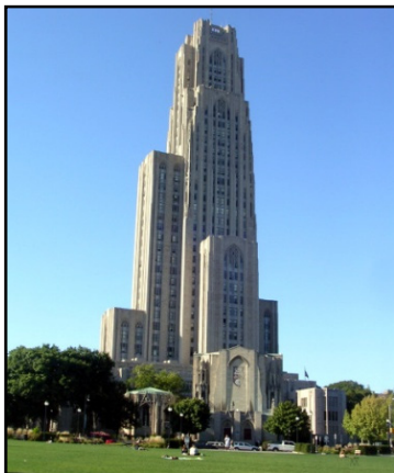
Fig. 26. Cathedral of Learning, Universitatea din Pittsburgh

Cred că s-a pierdut ceva și din respectul pentru profesori, față de instituția de învățământ. Le spuneam studenților că universitatea este „Catedrala științei” și le povesteam despre vizita de documentare pe care am făcut-o în 2007 la Universitatea din Pittsburgh, unde cea mai impunătoare clădire, un turn de 163 m (42 de etaje) poartă numele „Cathedral of Learning”. (fig. 26)