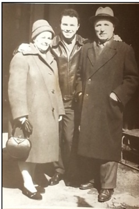
Fig. 21. Cu părinții (București, 1966)