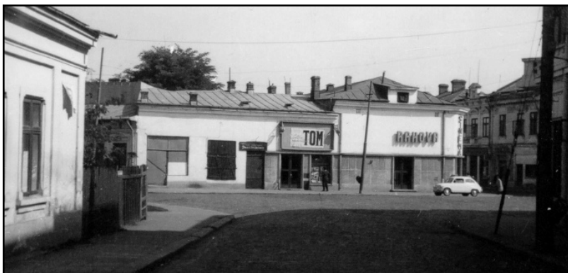
Fig. 12. Cinematograful „Rahova”

Punctul de atracție pentru mine nu era nici librăria, nici cinematograful, ci micul magazin de coloniale „Julius Meinl”, lipit de librărie. Mirosul din micuțul magazin de coloniale era balsam curat. Între simțul olfactiv și memorie există o strânsă legătură. Se cunoaște, de asemenea, puterea mirosurilor în evocarea amintirilor. Când, prin 2010, s-a deschis în Piața Unirii o Cafenea cu firma „Julius Meinl”, m-am repezit să regăsesc mirosul ambiental din magazinul de coloniale de pe Calea Rahovei. Era și nu era același. După 70 de ani, sensibilitatea olfactivă a oamenilor scade!