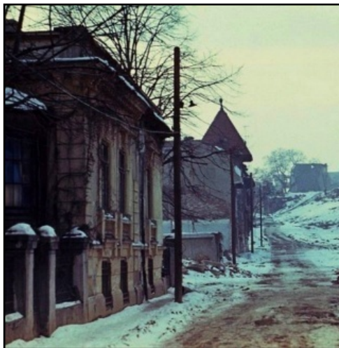
Fig. 9. Strada Lăzureanu, în demolare