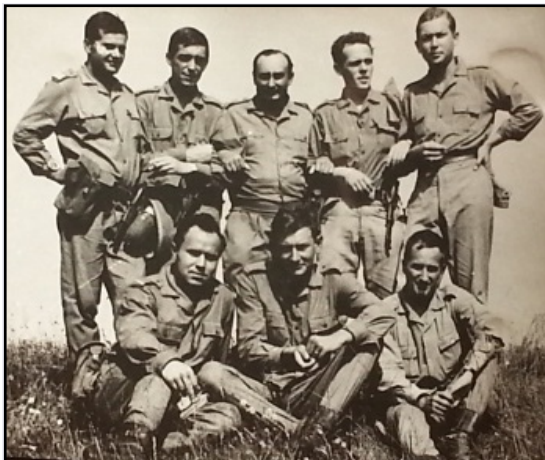
Fig. 17 Când am făcut armata... (C.S., primul din stânga, în primul rând)

biserică din Dragoslavele, în drum spre Rucăr. I-am botezat și fetița. Ce zile frumoase! (fig. 17)