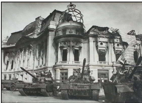
Fig. 23. Biblioteca Centrală Universitară „atacată” de teroriști și apărată de armată în Decembrie 1989

intrările la metrou. Am văzut cu ochii mei camioane aducând sicrie – erau morții revoluției. Erau îngropați într-un teren viran, spațiu verde lângă Cimitirul Bellu. Acum este „Cimitirul eroilor”. Biserica de acolo s-a ridicat mult timp după ce au fost puse crucile de marmură la mormântul martirilor”.