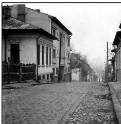
Fig. 1. Strada Lăzureanu, înainte de demolare

Pe Strada Lăzureanu, colț cu Strada Seneca, ce lega Lăzureanu de Cazărmii, funcționa un atelier de fabricat și de umplut sifoane. În curtea atelierului era și un grajd pentru cai, în partea dreaptă. În stânga curții erau aliniate cele trei-patru căruțe. Proprietar era unul, Sepoșanu – parcă așa îl chema. Sifoanele din sticlă groasă, colorată în roz, albastru sau verde, erau puse în lăzi de lemn, câte opt bucăți, și distribuite cu căruțele-platformă trase de cai pe la restaurantele din cartier. Căruțele aveau roți de cauciuc, ca de mașină. Nu făceau zgomot pe macadamul străzii. Se auzeau doar copitele oboseite ale cailor. Noi, copiii, pândeam la colțul străzii dinspre Uranus căruțele care se întorceau la atelier. Dacă venea „Nenea Bunul”, ne agățam de căruță și călătoream ca în caleașcă. Dacă apărea „Nenea Răul”, tot ne agățam la spatele căruței. Adesea, simțeam biciul căruțașului peste mâini, peste cap. Înjurăturile nu mai mi le amintesc. (fig. 1)