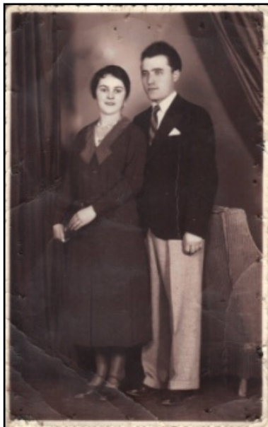
Fig. 7. Părinții mei, în tradiționala fotografie de dinaintea nunții (Câmpulung Muscel, 1932)