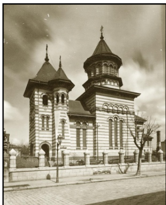
Fig. 10. Biserica Spirea Veche (cartierul Uranus, București)

Biserica Spirea Veche (ridicată pe la jumătatea secolului al XVIII-lea) – reconstruită în 1921 după planurile profesorului Ioan D. Trajanescu – a fost printre primele biserici la a căror structură de rezistență s-a folosit betonul armat. A fost dărâmată (dinamitată) în 1984.