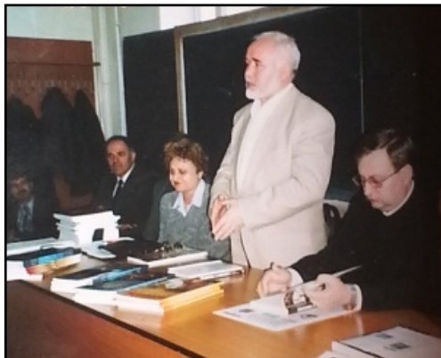
Fig. 28. Lansarea Enciclopediei de psihosociologie la Universitatea din Pitești (24 martie 2004)

Din inițiativa profesorului Cornel Constantinescu, la Editura Universității din Pitești a fost publicat un volum omagial Septimiu Chelcea la împlinirea vârstei de 60 de ani (vezi C. Constantinescu, ed., Chelcea Septimiu. Omagiu , Pitești, Editura Universității din Pitești, 2000). Pe coperta a IV-a a primului volum din seria „Profiluri sociologice” (până în 2015 au văzut lumina tiparului 12 volume), scriam plin de „avânt tineresc”: