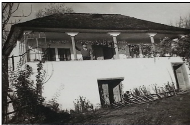
Fig. 3. Casa bunicilor din Boteni (Muscel), construită la sfârșitul secolului XIX.

Tatăl meu a avut două surori, pe Anica, sora mai mare, și pe Mița, care locuia și ea în casa părintească: într-o cameră ea, în cealaltă cameră noi, bucureștenii, părinții și surorile mele. (fig. 3)