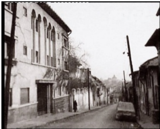
Fig. 8. Blocul de trei etaje și zidul alb de vizavi de casa părinților mei

Am mâncat și eu caise și roșii de acolo. De curte și de grădină se ocupa un soldat, ordonanța domnului maior. Și avea maiorul și o fată, și un băiat cam de aceeași vârstă cu mine, dar nu mă băgau în seamă, nu se jucau pe stradă: aveau soldați de plumb, trenuleț pe șine, păpuși, leagăne. În 1948, domnul maior a fost deblocat, scos din rândurile armatei. Mama-soacră plecase la Paris. Ce s-a întâmplat mai departe cu familia lui nu știu decât din auzite: au plecat cu toții în Franța. Cert este că, în 2015, băiatul vecinului meu a făcut o scurtă vizită la București. S-a întâlnit cu unii dintre colegii de școală. Venea din SUA. Eu nu am fost chemat la această întâlnire.