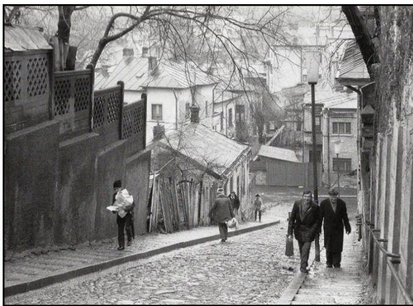
Str. Pelerinilor (Str. Scăricica) (foto Dan Dinescu, 1984)

ori dealul, găsim mai ales plăcere să vadă plutind pe râulețul subțirel de lături ce curge veșnic la vale prin mijlocul Scăricicăi bețișoare ori bărci făcute dintr-o foaie de caiet. Se bucură peste măsură văzând cum sar barca și plutele peste groaznice cataracte la fiecare treaptă. Când plouă tare și pot urca dealul bălăcind în apă cu picioarele goale, bucuria lor nu are margini. Iarna apoi, când zăpada a nivelat treptele, când Scăricica este de sus și până jos un povârniș periculos de gheață, numai ei îndrăznesc să o urce cu săniuțele și răsună Scăricica de veselia lor zgomotoasă (H. Stahl, Bucureștii ce se duc , ediția a III-a, București, Editura Do-minoR, 2002, p. 25).