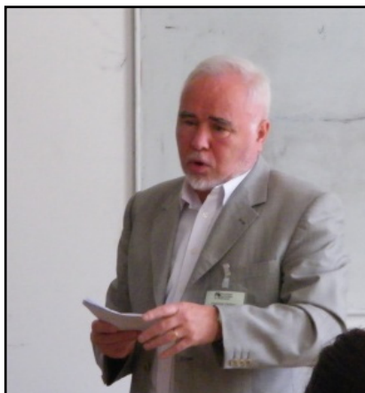
Fig. 25. Mulțumind pentru acordarea diplomei (mai 2011)

M-am încăpățânat să arăt că se impunea corectura: după ce am lăsat în urmă 70 de ani, am mai publicat singur sau în colaborare câteva cărți ( Manual de redactare în științele socioumane , 2011; Psihosociologia publicității. Despre reclamele vizuale , 2013; Psihologie socială. Studiul interacțiunilor umane , 2013; Psihosociologia opiniei publice , 2015; Fricile sociale ale românilor , 2015; Psihosociologie aplicată. Publicitatea , 2016). Sper ca această carte, din care dumneavoastră citiți ultimele pagini, să nu fie cea din urmă. Cunosc dictonul „Speranța moare ultima”, dar sunt „Septimist” și îmi știu manuscrisele de pe masa de lucru.