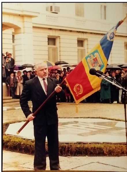
Fig. 24. Drapelul de luptă (26 oct. 1995)

Drapelul de luptă nu este țesut din fir de mătase și aur, ci din viețile ostașilor căzuți la datorie, din idealurile noastre de unitate, integritate și suveranitate națională. Steagul nostru este sfânt . Pierderea lui materială înseamnă pieirea noastră ca unitate militară, dispariția lui ca simbol din suflete echivalează cu distrugerea identității naționale – mai rea decât moartea. Să păstrăm drapelul sub faldurile căruia ne desfășurăm activitatea spre binele Patriei și onoarei fiecăruia. Vitejia să biruiască, înțelepciunea să triumfe! (vezi revista Psihosociologia , 1995, nr. 4, p. 1). (fig. 24)