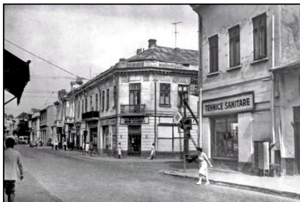
Fig. 11. Intersecția „Calea Rahovei” cu Strada „Antim” înainte de demolare

Intersecția Străzii Antim cu Calea Rahovei constituie al doilea centru al hărții mele mintale. Imaginați-vă: pe un colț, o librărie (Librăria „Grigore Alexandrescu”, vizavi de un magazin de „Fierărie. Tehnice. Sanitare”). (fig. 11)