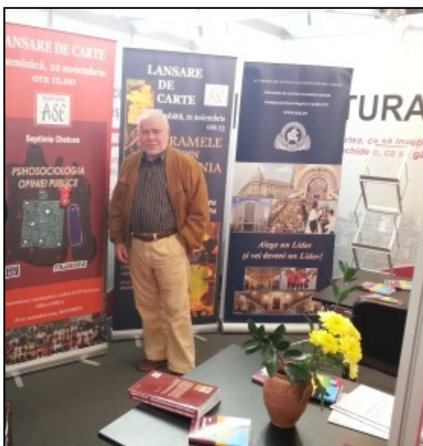
Fig. 29. La Târgul Internațional „Gaudeamus” (2015)

Am început să-mi scriu amintirile când am împlinit 75 de ani, după ce am participat la Târgul Internațional Gaudeamus Carte de învățătură, unde am lansat lucrarea Pihosociologia opiniei publice (București, Editura ASE, 2015). (fig. 29)