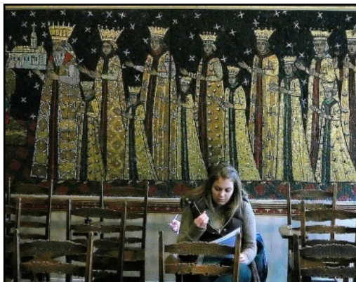
Fig. 27. Fresca din sala de curs „România” din „Catedrala învățării” (Universitatea din Pittsburgh)

Turnul cu funcționalități multiple are și 27 de săli de clasă amenajate, fiecare în specificul cultural al unui popor sau grup etnic. Între acestea se află și cea a României. Sala română a fost decorată în stil bizantin în 1943 de către arhitectul Nicolae Ghica-Budești. (fig. 27)