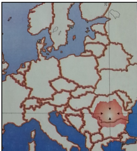
Fig. 13. Harta mentală a României la studenți (S. Chelcea, 1998)

Spuneam atunci, în urmă cu aproape douăzeci de ani, că desenarea României de către un număr semnificativ de studenți mai spre sud și mai mică decât apare pe harta geografică este expresia „identității naționale negative” a românilor, care, chipurile, au „o țară mică”, „balcanică”. S-a schimbat această hartă mentală? Înclin să cred că nu. Ar merita reluată cercetarea.